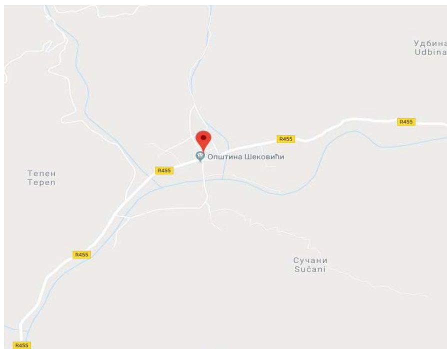
Путна мрежа Општине Шековићи

Шековачки крај од Римљана до данашњих дана расијецали су важни путеви који су повезивали подручја источно од Дрине са централном Босном. Шековићи су добили име по једном дијелу становника који су из Шековине у Херцеговини населили ове просторе крајем XVII вијека. Шековићи су били релативно густо насељени, а тада су војне похаре или болести прориједиле и скоро уништиле старе житеље, а на мјесто њих су дошли нови из Херцеговине, који чине највећи дио данашњег становништва.